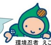
環境忍者 えこ之助