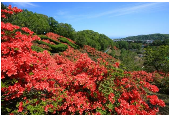
右: エコロジーパーク