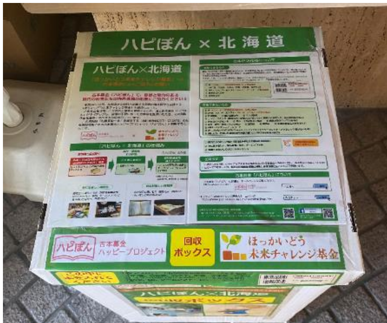
ハピぼん回収ボックス