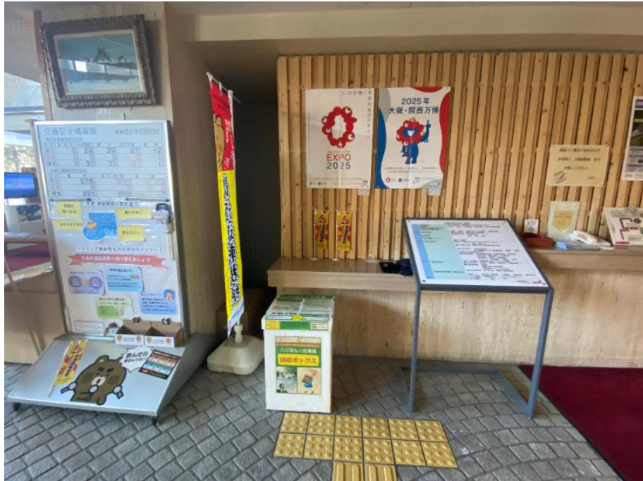
振興局1階ロビー受付前