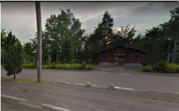
「浦幌町美園パーキング」