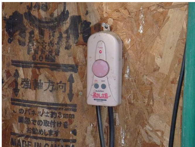
温度調節スイッチ