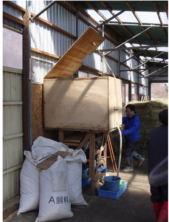
水タンクは断熱材を入れた箱の中に設置