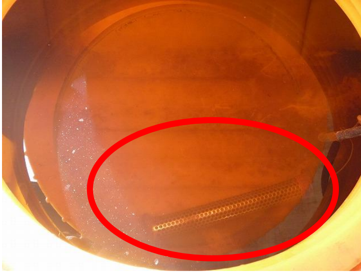
水タンクに入っている投げ込み保温ヒーター