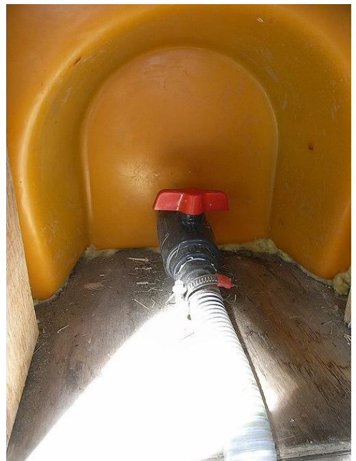
排水コックから水道管へ接続