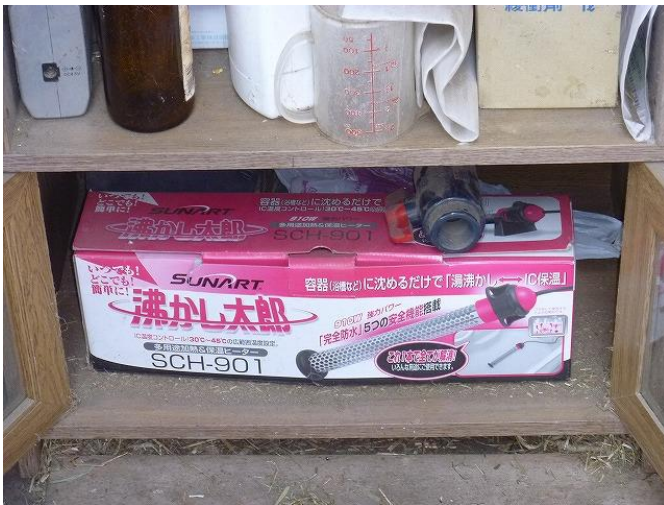
使用したヒーター(商品名:沸かし太郎)