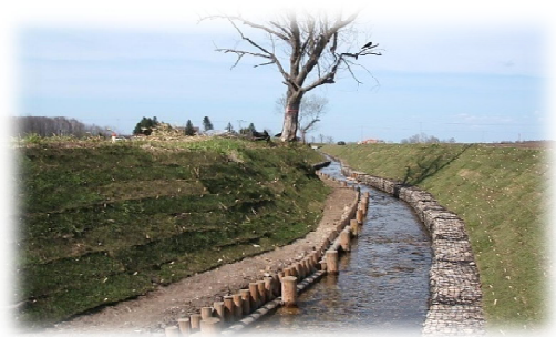
整備された排水路