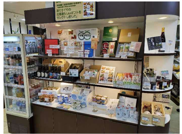
③店頭冷蔵・冷凍コーナー（2カ所）