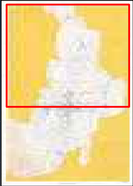
R元年度 施工箇所図 十勝川左岸