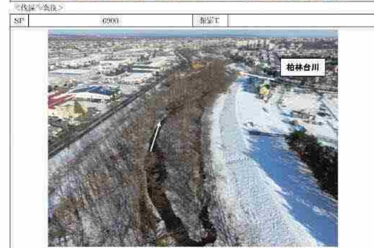
伐採前後の比較：UAV空撮斜め写真（左岸伐採前のもの） 2/3