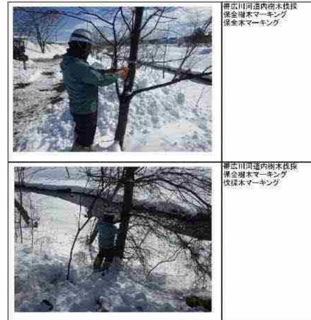
帯広川河道内樹木伐採 保全樹木マーキング 保全木マーキング