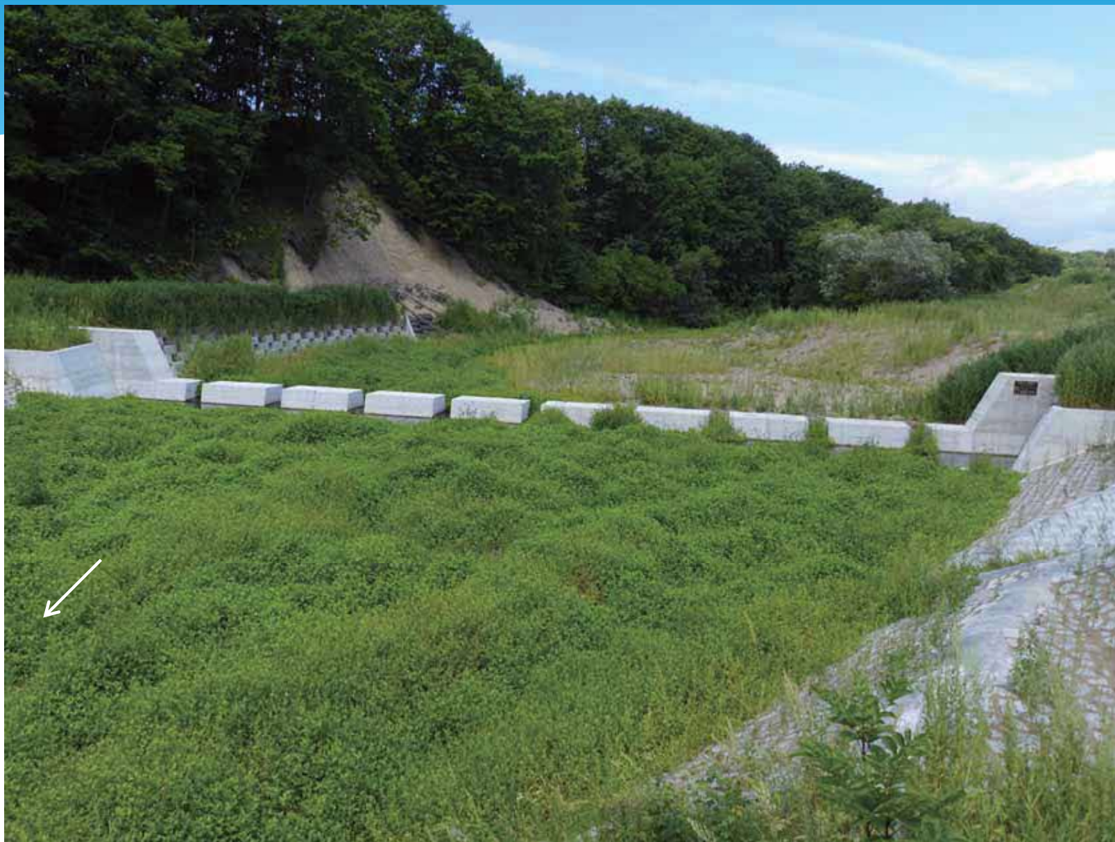
11号床固工 完成状況(R2.8.20)