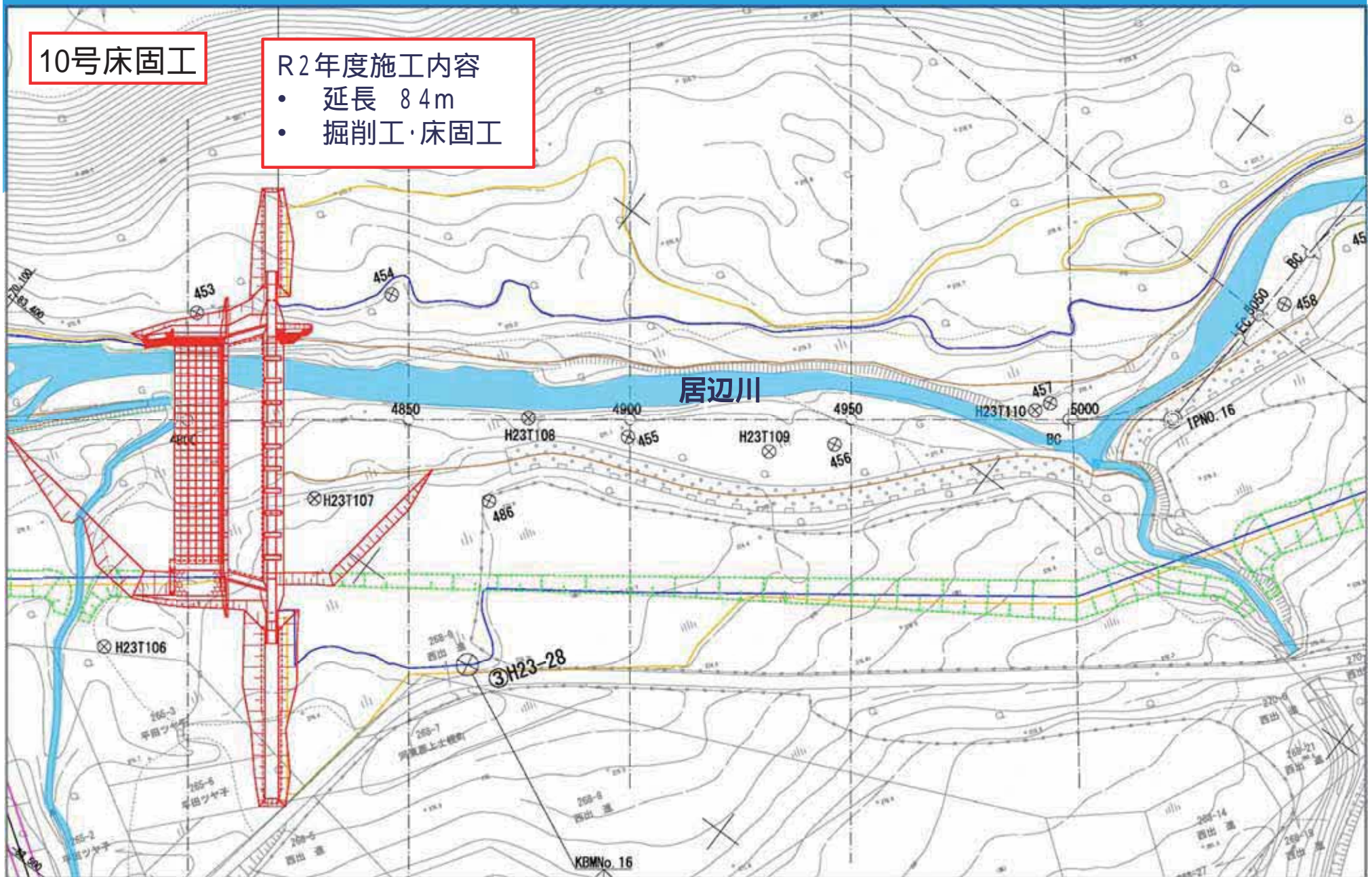
10号床固工 施工概要図(平面図)