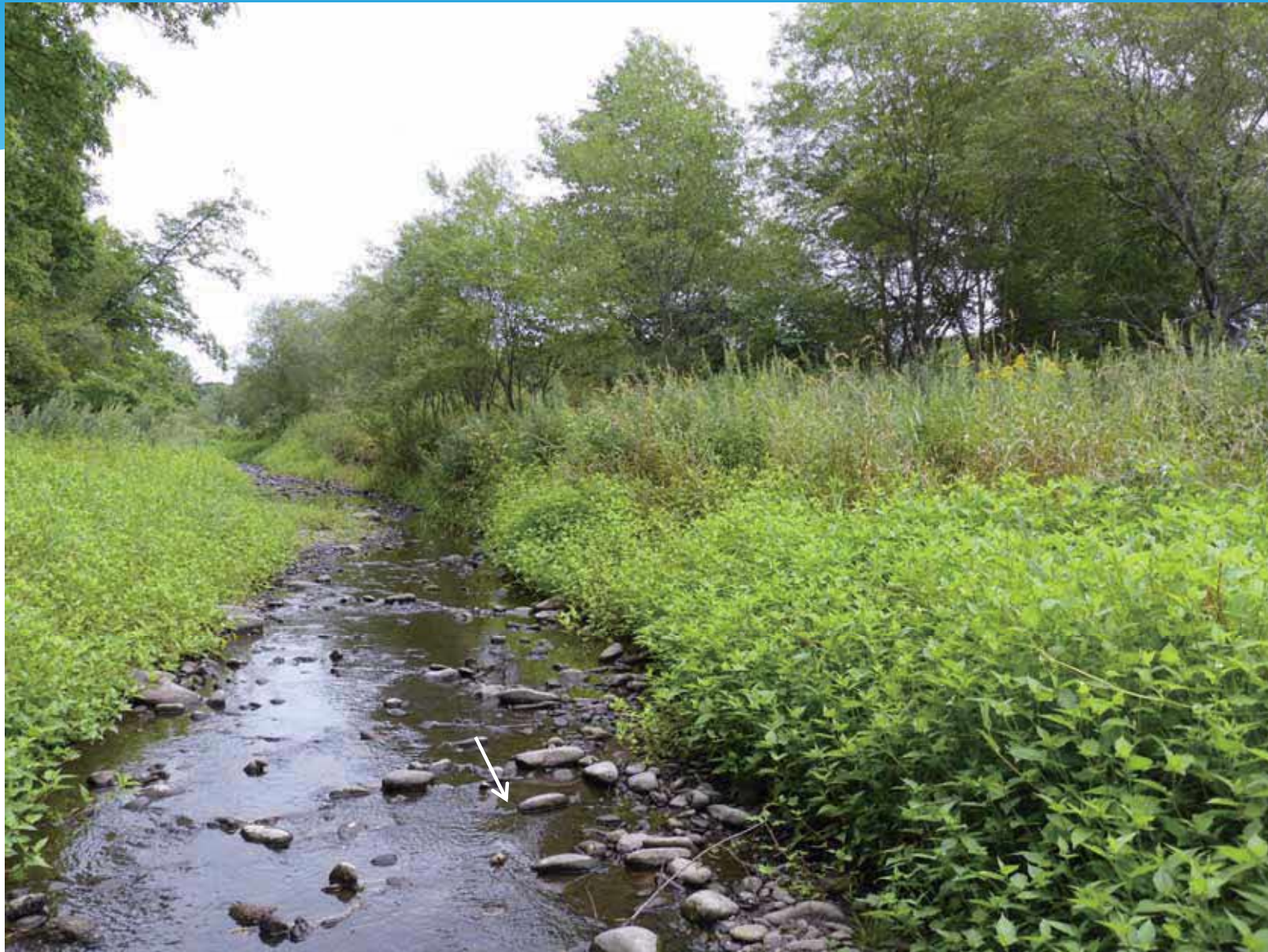
10号床固工 施工予定箇所状況(R2.8.21)