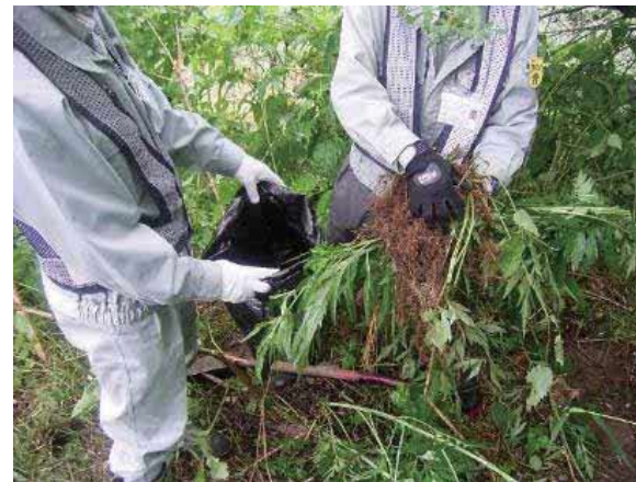
(参考)R元年度の特定外来生物処理