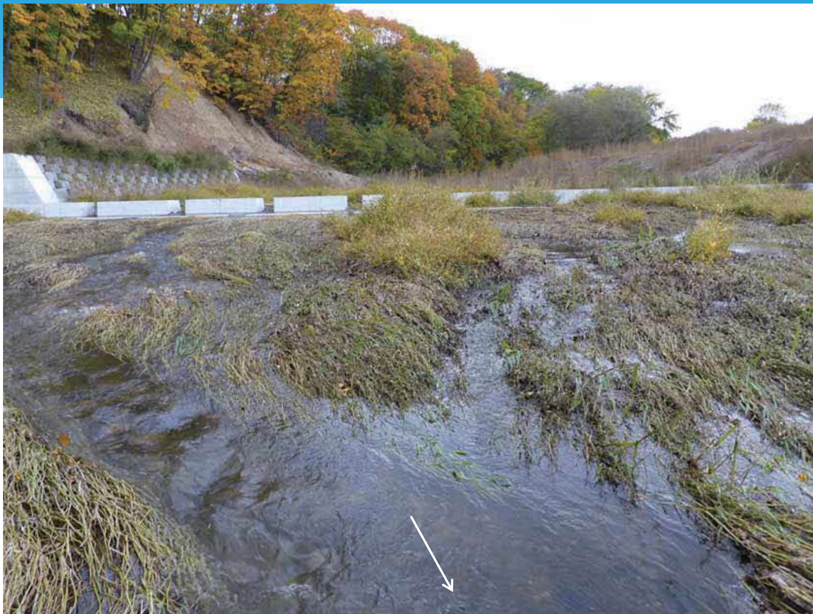
11号床固工 水量増加時状況 (R2.10.14)