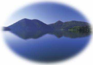
ミヤバイワナの棲息地 然別湖（鹿追町）