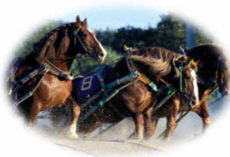
世界で唯一のばんえい競馬（帯広市）