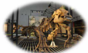
アショロア（足寄町）