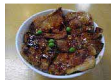
↑元祖・帯広名物「豚丼」