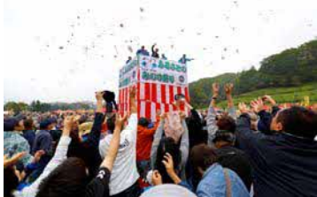
ふるさとのみのり祭り