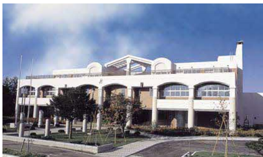
帯広高等看護学院

郵便番号：080-2464 住所：帯広市西24条北4丁目1番地5 TEL：0155-37-3491 FAX：0155-37-3494 URL： http://www.tokachiken.hokkaido.jp/