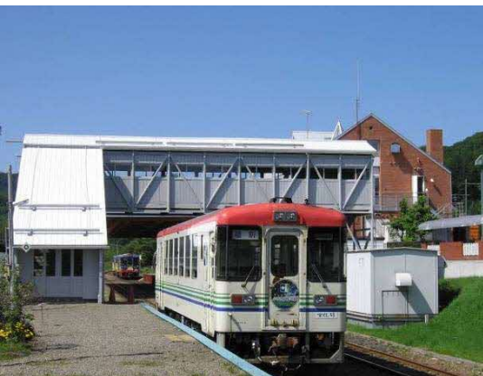
ふるさと銀河線りくべつ鉄道

アイヌ語で「鹿のいる川」または「危ない高い川」という意味の「リクンベツ」に由来しているといわれている。