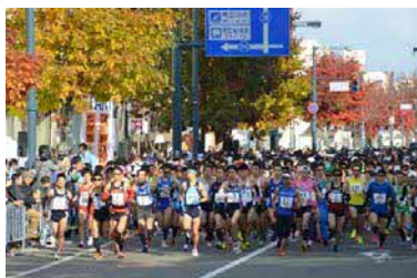
↑紅葉が彩るまちなかを疾走！ 「フードバレーとがちマラソン」

また、低炭素社会をめざし先駆的に取り組む「環境モデル都市」や、地域のバイオマスを活用して産業創出とエネルギーの地域循環の強化を目指す「バイオマス産業都市」に国から認定されており、農業・環境・エネルギーに関する取り組みを一体的に進めています。