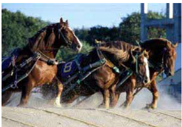
↑世界で唯一！「ばんえい競馬」