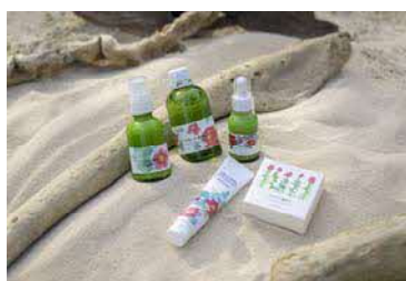
ハマナスオーガニックコスメ

十勝管内の最東端に位置し、町土の約74.2%を森林が占める雄大な自然と、海産資源豊富な太平洋に面した町です。