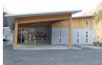
うらほろ留真温泉