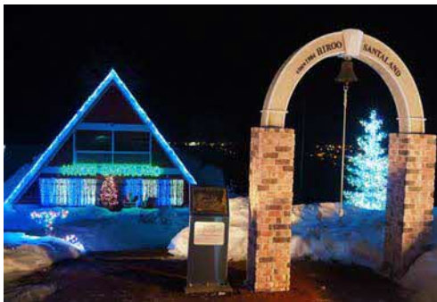
恋人の聖地「広尾サンタランド」

アイヌ語の「ピルイ」が語源といわれ、「ピ」は「石が転がる」、「ルイ」は「砥石がとれる地」という意味。