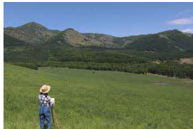
円山牧場（円山展望台）