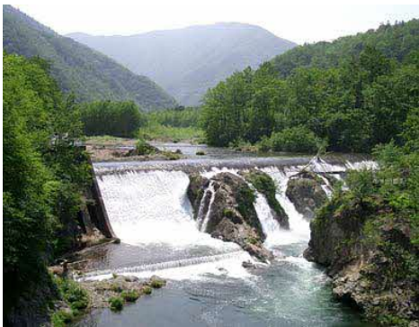
ピョウタンの滝（札内川園地）

札内川の語源であるアイヌ語で「乾いた川」を意味する「サチナイ」と、その中流に位置するという意味。