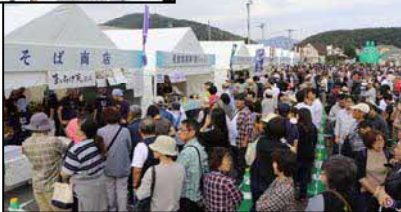
しんとく新そば祭り