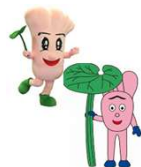
アユミちゃん：左足（二代目） アユミちゃん：右足（初代）

アユミちゃんの誕生日は足寄町の開町記念日の明治41年4月1日で、こう見えても100歳を超えています。初代の性格は明るくとても活発で元気。最近、永い眠りから覚めました。二代目は気さくでおとなしく、子どもたちと遊ぶのが大好き。現在は二人で様々なイベントに出演しています。