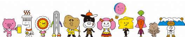
とかちの魅力PR大使

2011年にとかちの魅力PRする12のキャラクター「とかちの魅力PR大使」が誕生しました。