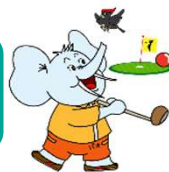
パオくん・クマガラクん

パオくんは、幕別町忠類地域で発掘されたナウマン象から誕生しました。パオくんといつも一緒にいるのは、パークゴルフのマスコットキャラクターのクマガラクん。休日は、大好きなパークゴルフをして楽しんでいます！