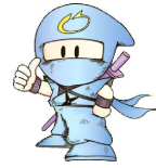
リサイクル 忍者 わけすけ

平成26年に学校給食のキャラクターとして誕生。平成27年4月からは給食の食器にプリントされ、学校給食のPRに活躍しています。