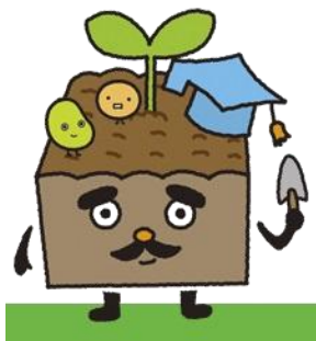
北海道クワ農業イメーヅキャラクター 「ハタケダ博士&くりーんだね」

本対策では、化学肥料、農薬の5割低減の取組とセットで行われる地球温暖化防止等に効果の高い営農活動や有機農業の取組に対して支援を行うこととしており、令和6年度では、全道で89市町村、十勝管内では15市町村で取り組まれている。