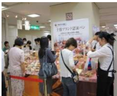
イベントでの販売・PR