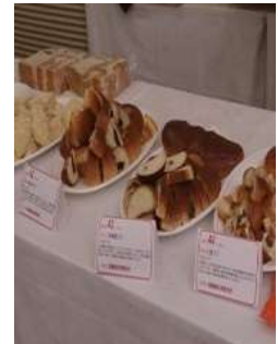
ブランド登録品の試食会