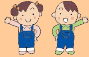
どさんこ愛食食べきり運動 イメージキャラクター 「大地くんとめぐみちゃん」

「おいしく残さず食べきろう！」をスローガンに「どさんこ愛 食食べきり運動」を展開している。