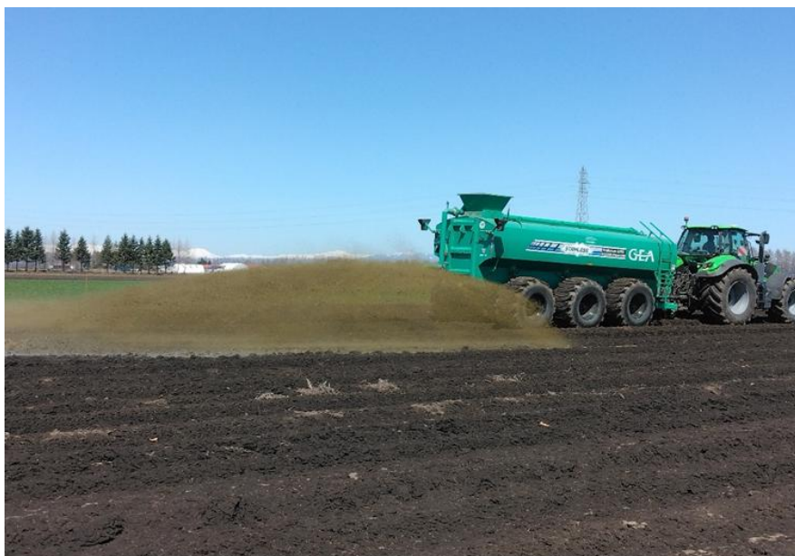
（スラリータンカーによる消化液散布）

メタン発酵消化液は、窒素やカリなどの肥料成分を含むとともに発酵の過程で雑草の種子が死滅しており、液肥としての利活用が可能であることから、今後の耕畜連携における新たな手段として注目されている。