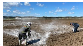
pH 改善効果確認試験のようす