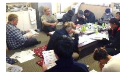
作戦会議のようす