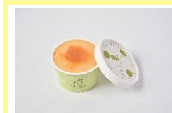
豆乳ジェラート 夕張メロン