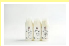
十勝オーガニック牛乳 （200ml）