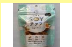
とがちSOYナッツ(オ レンジ&クランベリー)