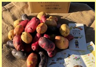
■十勝ガールズ農場（帯広市）