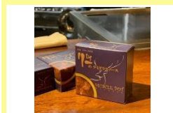
シェフの缶詰まっする ぼっと(えぞ鹿肉の缶詰) デミグラスソース煮