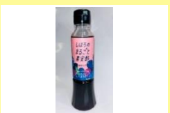
しほろのまるごと果実 酢ハスカップ