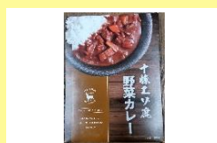
十勝エゾ鹿野菜カレー