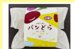
洋風あんバター ぱんどら 小倉あん