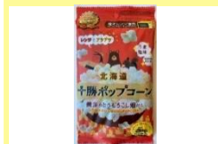
北海道十勝ポップコーン ～黄金のとうもろこし畑 から～