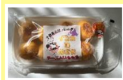
インカのめざめ チーズ入りいももち