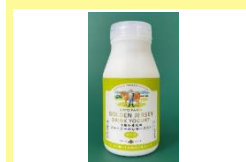
ゴールデンジャージー のおヨーグルトオリゴ