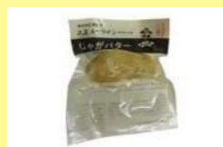
帯広大正農協の大正 メイクインでつくった じゃがバター