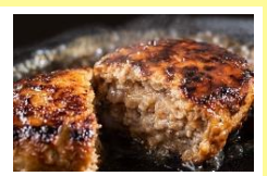
和牛道ハンバーグ