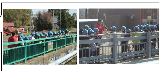
ネイバル足寄防災キャンプ