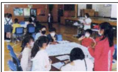
緑丘小学校防災学習