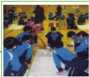
広尾中学校「防災教室」