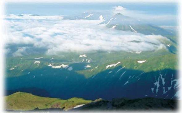
「トムラウシ山」山頂より（新得町）