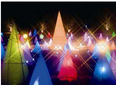
十勝川白鳥まつり 彩凧華 (1月下旬～2月下旬頃)