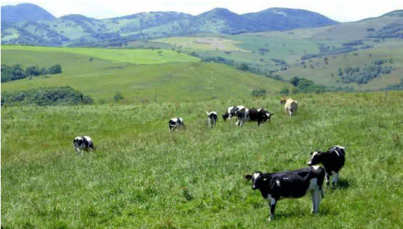
ナイタイ高原牧場

昭和6年士幌村より分村し、士幌村の川上に位置していたため、「上士幌村」となった。