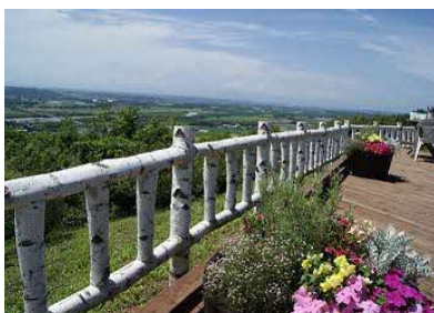
十勝が丘展望台シーニックカフェ (7月上旬～9月下旬頃)

音更町は、広大な十勝平野の中心部に位置し、十勝川を挟んで帯広市の北側に隣接しており、町村の中では全道一の人口を有する活気に満ちたまちです。