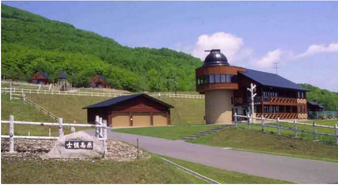
士幌高原ヌブカの里

“広大な土地”を意味するアイヌ語の「シュウウォロー」が訛って変化して名付けられたといわれている。