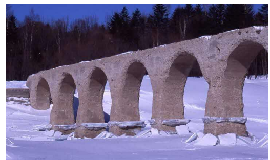
タウシュベツ川橋梁(冬)