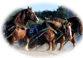
世界で唯一のばんえい競馬（帯広市）