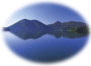
ミヤベイワナの棲息地 然別湖（鹿追町）