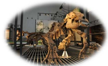
アショロア（足寄町）