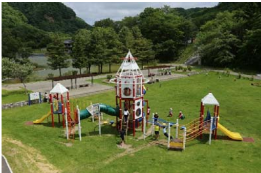
義経の里本別公園

アイヌ語の『ボン・ペツ（小さい川）』を語源とし、本別市街地で利別川と合流する本別川から名付けられました。道の駅「ステラ★ほんべつ」では、本別町のゆるキャラ「元気くん」が入り口で多くの観光客を出迎え、町内特産品の販売や、観光情報を発信しています。また、道東自動車道のインターチェンジや、釧路方面と北見方面への分岐点もあり、道東圏と道央圏を結ぶ交通の要衝となっています。