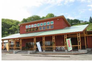
とよころ物産直売所