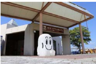
道の駅「ステラ★ほんべつ」