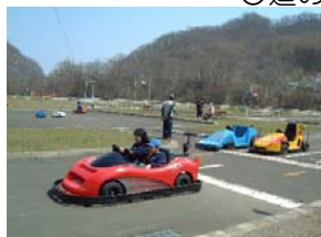
交通公園ゴーカート