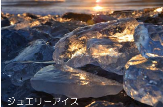
ジュエリーアイス

「トエコロ」（大きなフキが生えていたところ）や「トイ・コロ」（土多く礫少ないところ）等のアイヌ語が語源とされています。