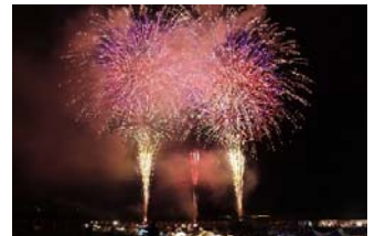
きらめきタウンフェスティバル