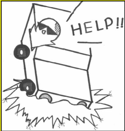
【氷上への車の乗り入れは危険】