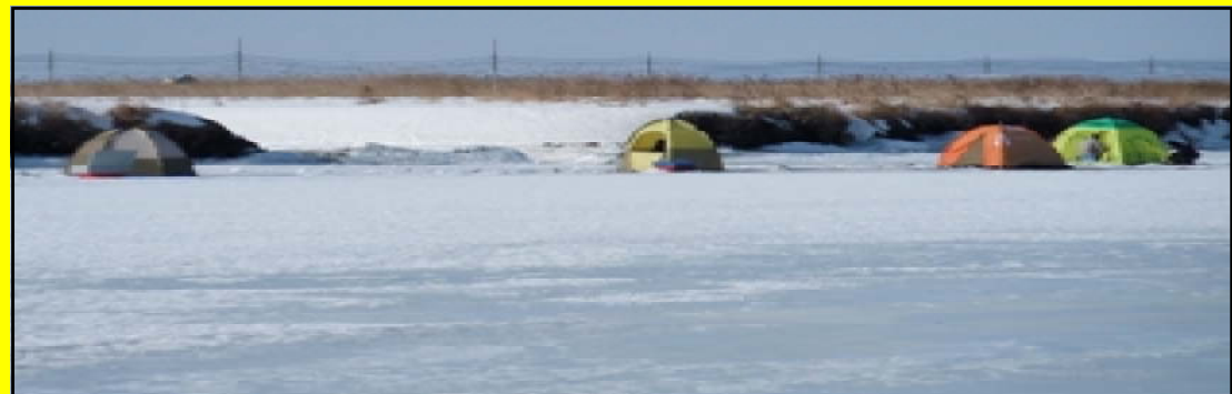
【写真手前の川の中心部の氷が薄くなって危険な状態】