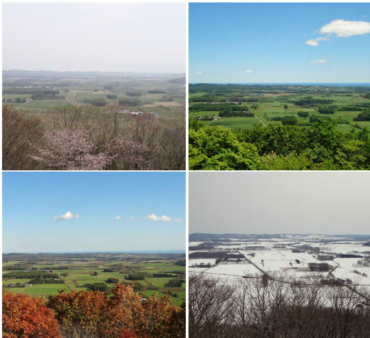
(幕別町忠類 丸山展望台から望む道有林)