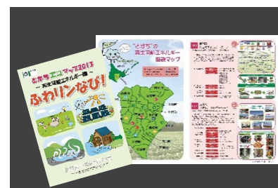
『ふわリンなび!』 ～再生可能エネルギー編～