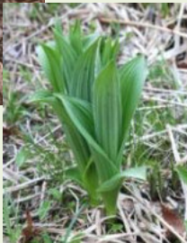
芽出し期 のコバイケイソウ