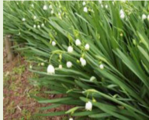
スノーフレーク (スズランスイセン)