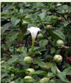
チョウセンアサガオの葉と花