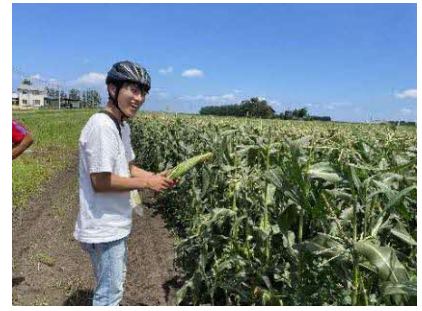
解説の後は収穫体験。良いトウモロコシの状態と収穫方法を教えていただいた。