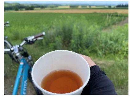
芽室はごぼうの産地であるため、ごぼう茶をいただく。