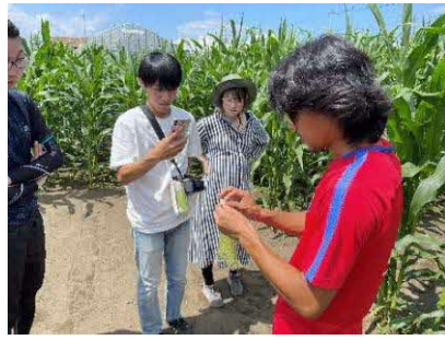
トウモロコシの解説をしていた。成長しきっていないトウモロコシを見せていただいた。