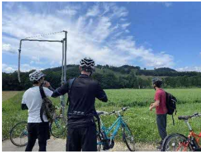
サイクリング実施時は、休憩を兼ねて畑の解説等も行われる