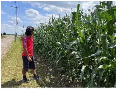
高野農場では、旬のトウモロコシ狩りを行う。当日は長芋の時期であるため、長芋堀を実施。