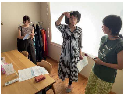
当日の流れの確認と料理体験の中身の打ち合わせ。農場見学も併せて行うことになった。